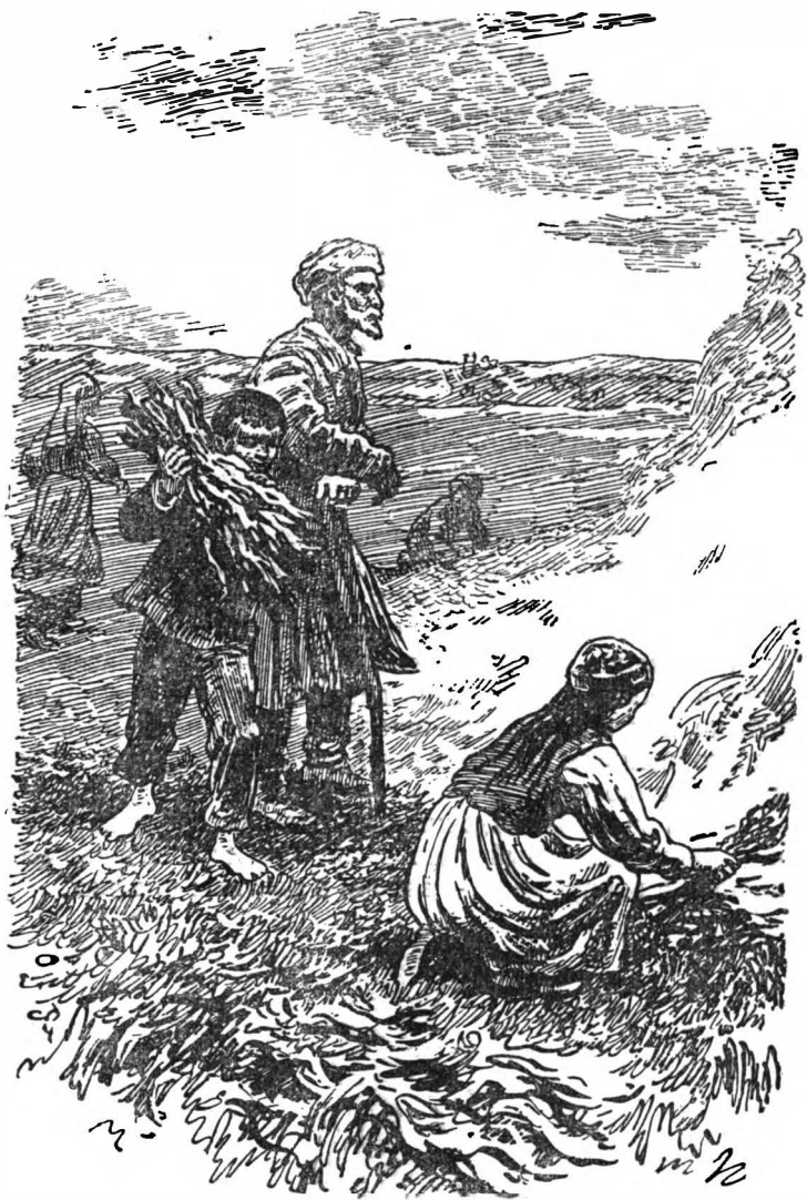
Множество дымков скоро слилось в один.