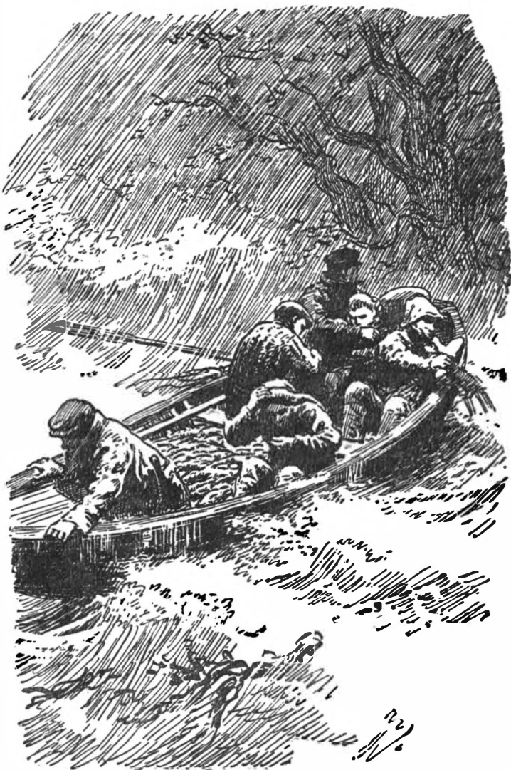
Волны захлёстывали людей и снасти белой пеной.