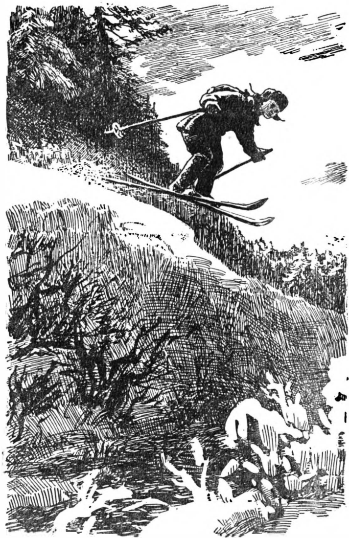
Тимка сильным движением бросился вниз.